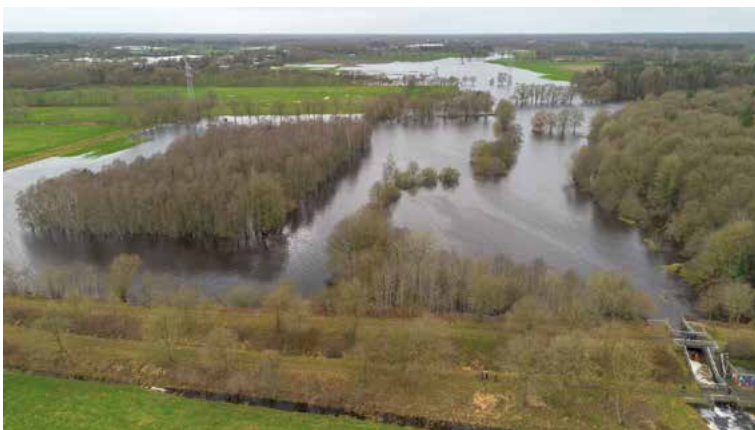
Haaren-Rückhaltebecken bei Extremhochwasser